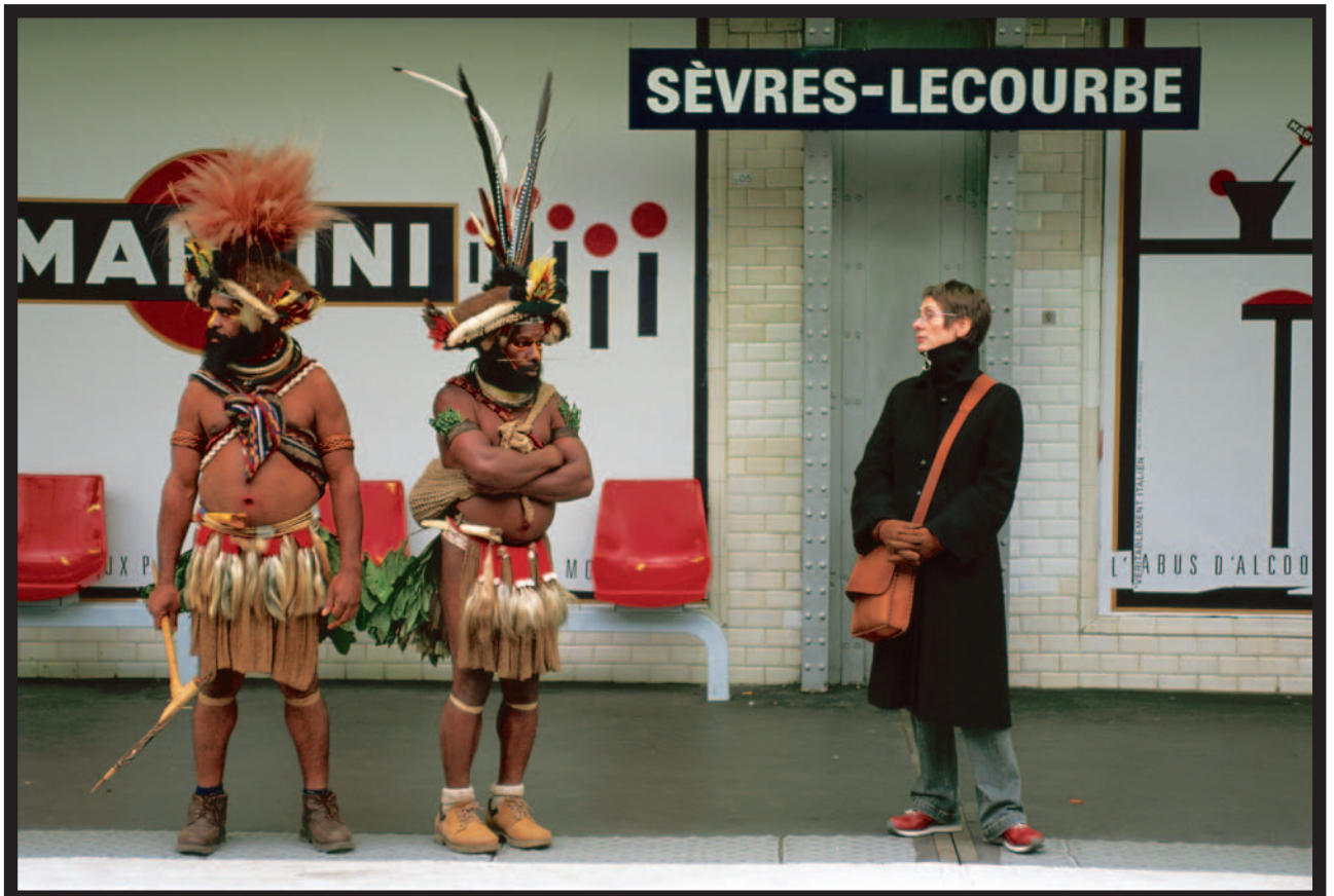
«En France, la tribu des Paris se déplace sous terre.» Mudeya, explorateur papou